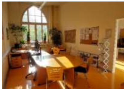
Beratungsraum des GBZ in der VHS Halle (Saale)

Nachfrageorientierung bedeutet für das GBZ, dass ein Kurs mit Schwerpunkt Lesen und Schreiben ab einer Teilnehmer*innenzahl von mindestens 4 Personen umgehend beginnen kann. Auch dieses kursförmige Bildungsangebot ist komplett kostenfrei.